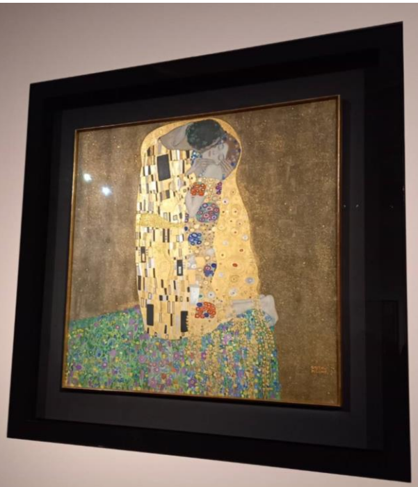
右) クリムトの『接吻』