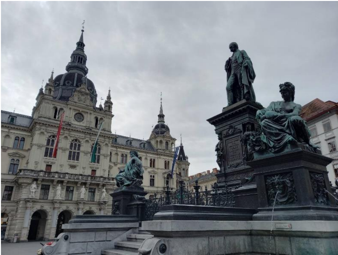
グラーツの市庁舎とヨハン大公像