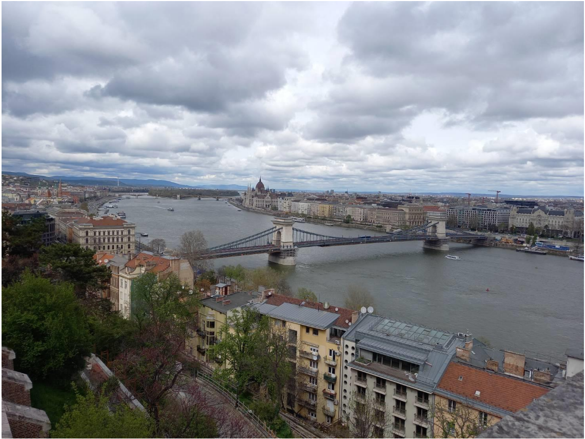
ブダ城から望むブダペストの風景