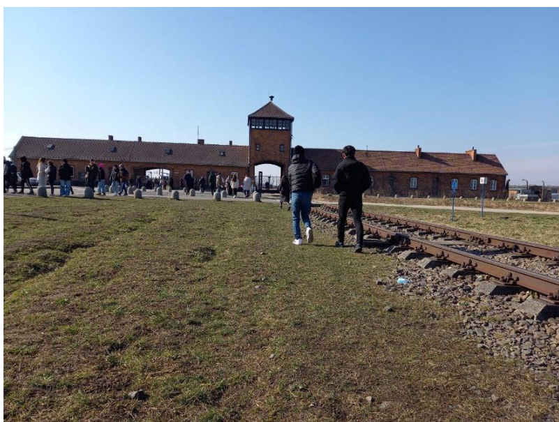
上) 有名な Arbeit macht frei の標識、下) ビルケナウ収容所に続く線路