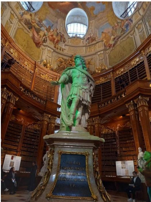
左) オーストリア国立図書館