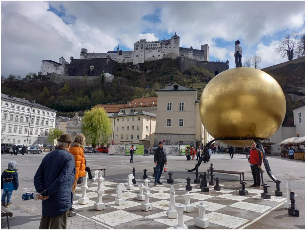
ホーエンザルツブルク城