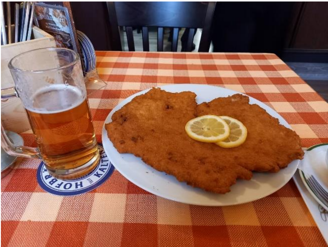
本場の Wiener Schintzel

余談にはなりますが、トリーアに戻ってきて同じく春休み中にウィーンに行ったドイツ人の友人と話したところ、「ドイツ文化」の首都はベルリンではなく、ウィーンだという意見が一致しました（彼自身はベルリン出身）。些細なことかもしれませんが、個人的にはドイツ人の感性に少しでも近づけたような気がして嬉しかったです。また、ドイツから見て東側の地域にばかり行っているのので、最近彼から名前をもじって「東欧介」と呼ばれもします。個人的にはエキゾチックで悪くない響きだと思うので気に入っています。