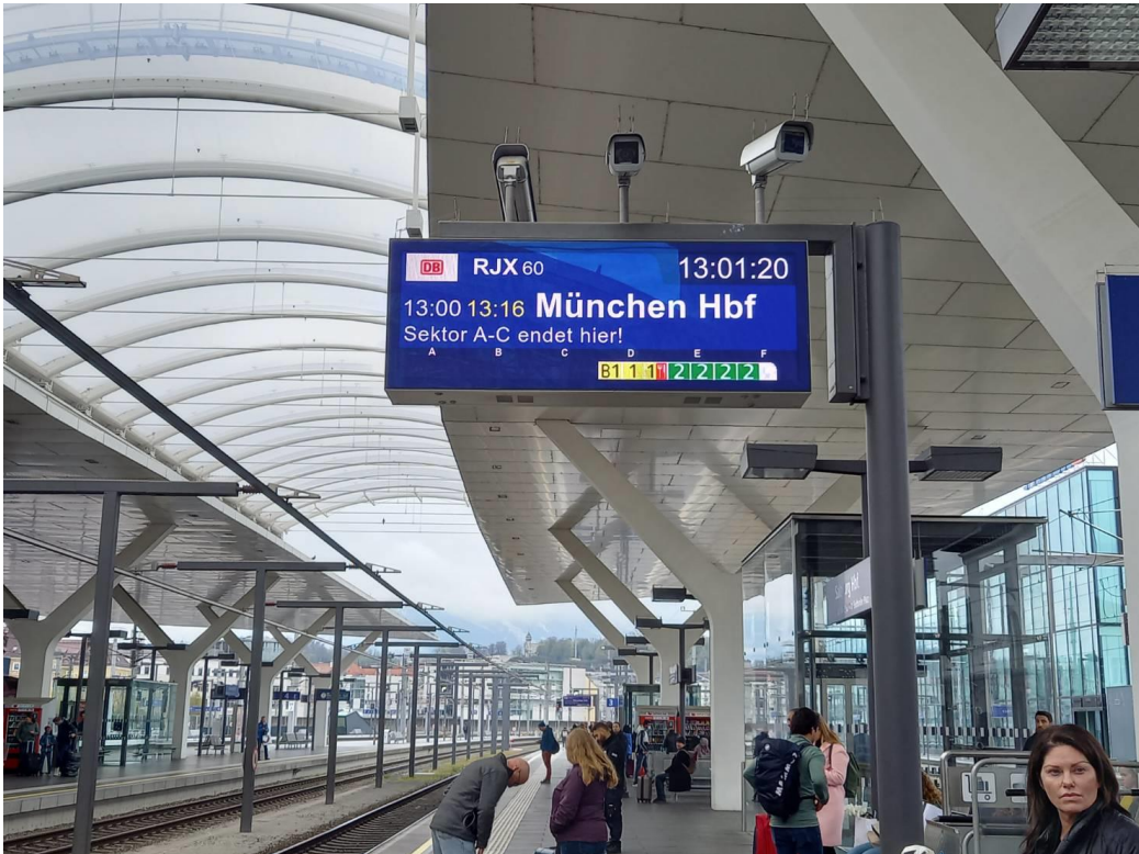
軽めの電車の遅延には慣れてきました