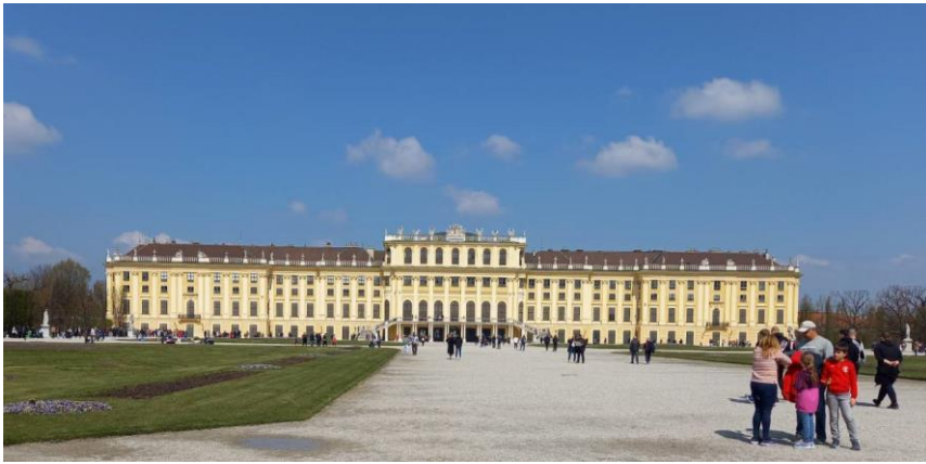
シェーンブルン宮殿