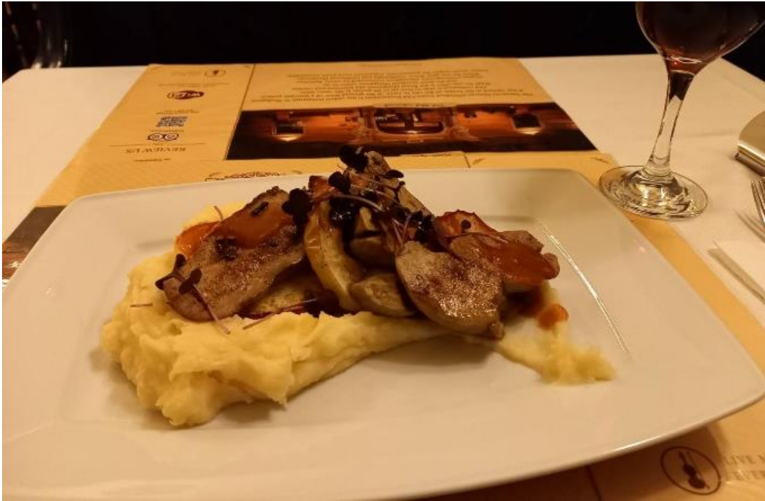
ブダペスト名物のフォアグラ