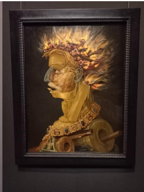
左) デューラーの『マクシミリアン1世像』 右) アンチンボルドの『火』