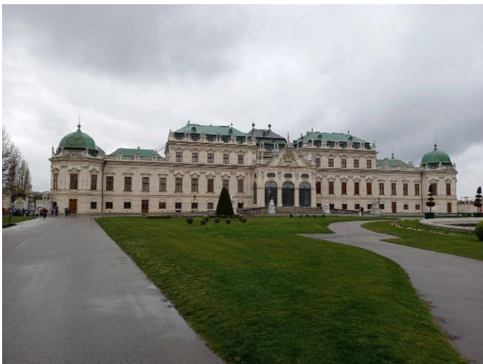
ベルヴェデーレ宮殿