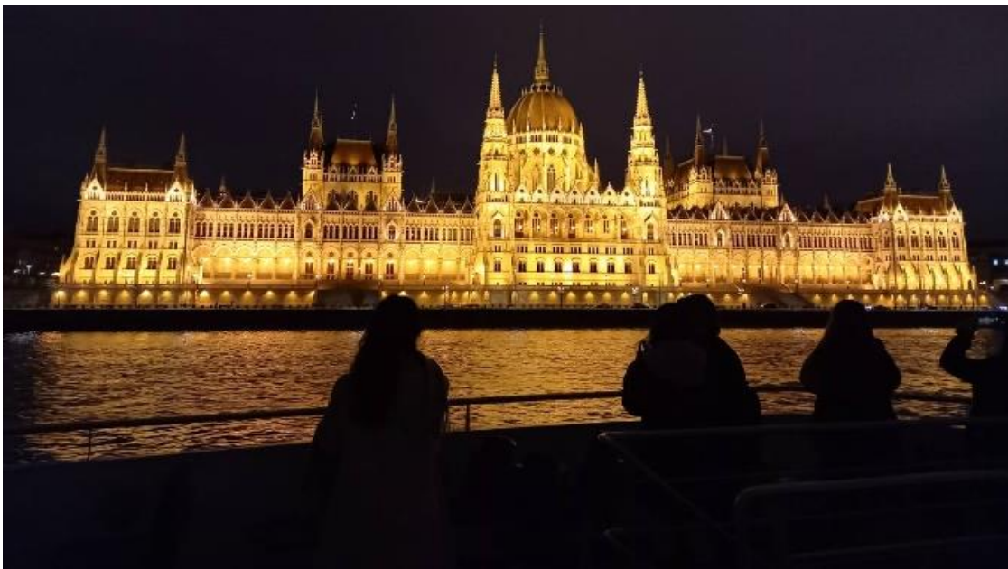
ハンガリーの国会議事堂